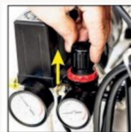
вентиль редуктора давления